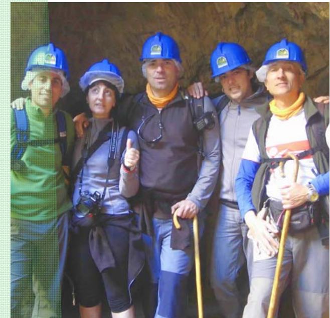
(Minas de la Jayona-Badajoz). Multiaventura

Programa anual de actividades de senderismo y multiaventura, organizadas por el C.D. ALAVEN de Sevilla.